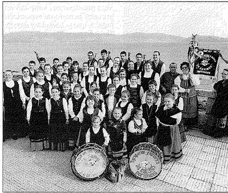
Componentes del grupo Os Gatiños.