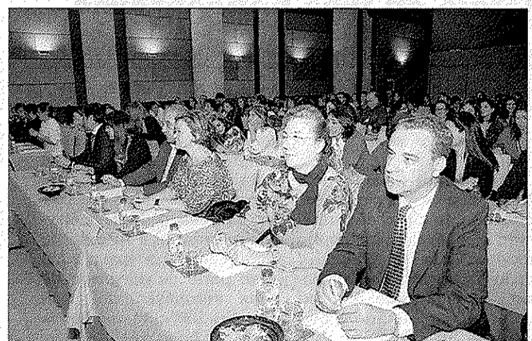
Asistentes al Congreso de Xerontoloxía que se inauguró ayer.