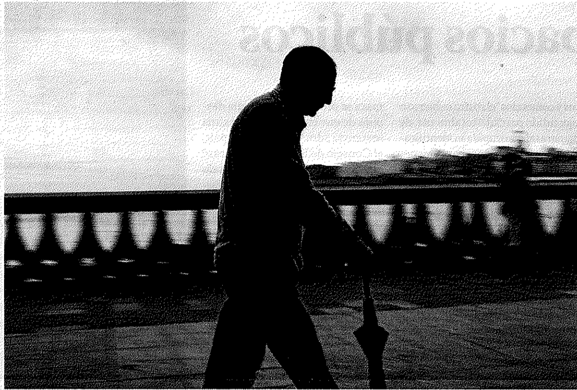
Un ancián camiña pola rúa

O médico tamén advertiu de que actualmente en Galicia hai case 800.000 persoas maiores de 60 anos, o 28% da poboación total galega. Este problema afecta espe-