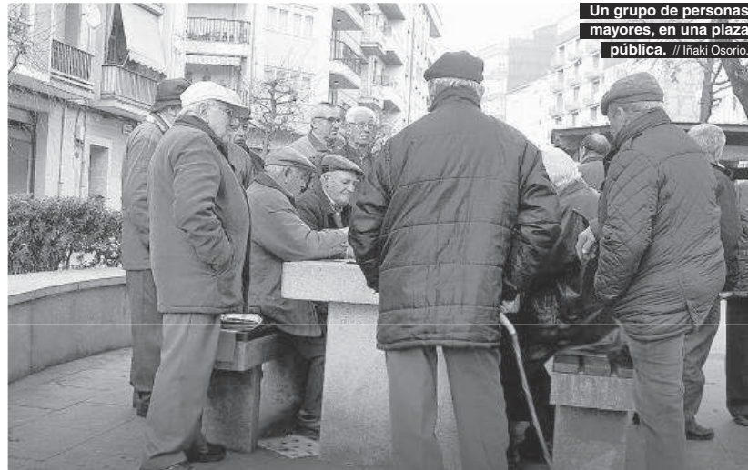
Un grupo de personas mayores, en una plaza pública.

Aplicando este criterio, en 2015, un varón español con 65 años (edad