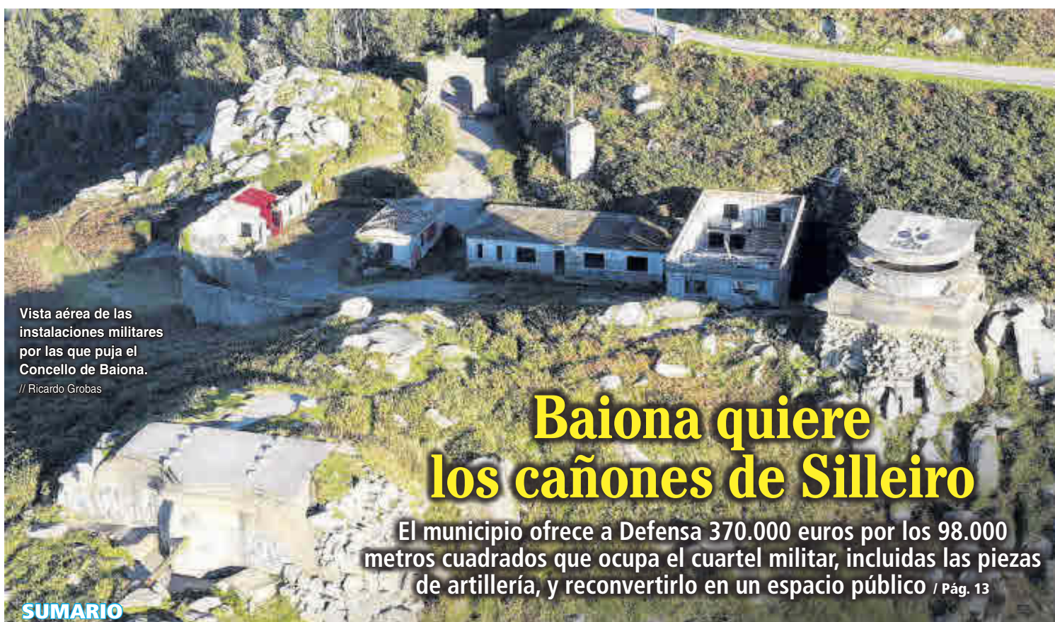
Vista aérea de las instalaciones militares por las que puja el Concello de Baiona.

▶ Diseña una desescalada en cuatro fases que arrancaría antes del puente ▶ Sanidad notifica casi 20.000 casos y 401 muertos desde el viernes / Pág. 28