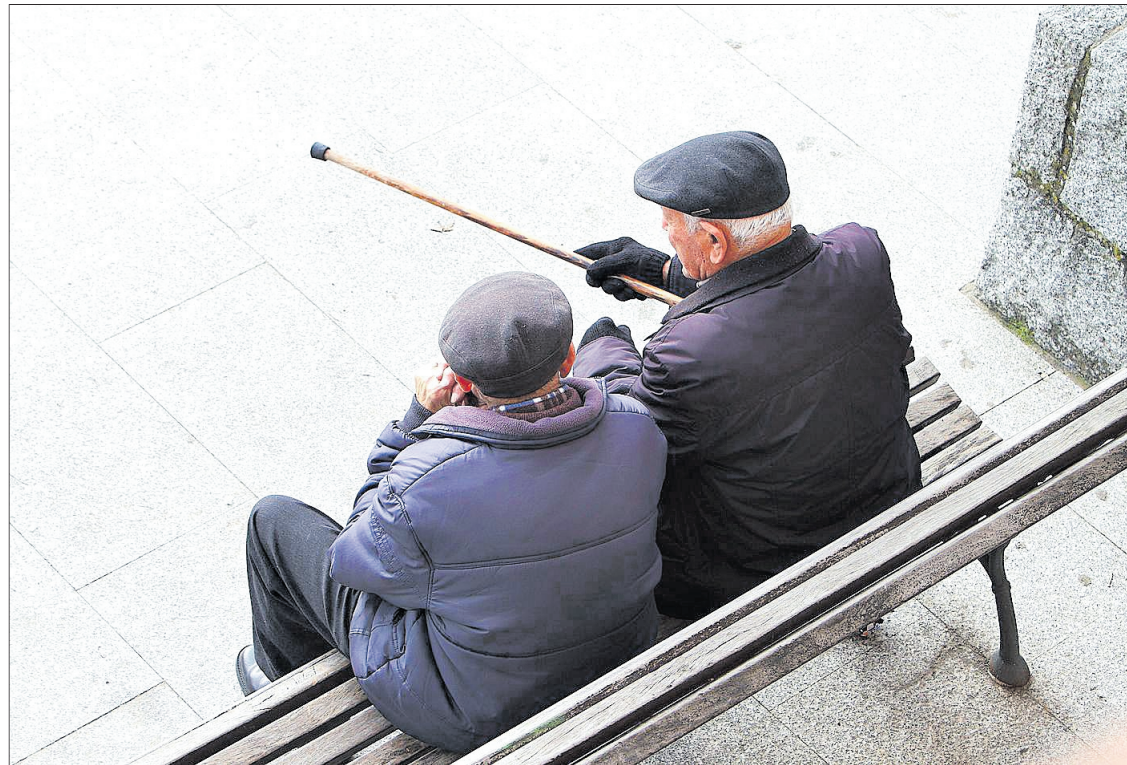
Los hombres charlan en un banco de la ciudad.

El experto reconoce que el principal reto es atender a las personas que requieren "altos niveles" de cuidados, una demanda para la que la comunidad gallega no está preparada. "Los recursos que están llegando no son suficientes con carácter general, no solo en Galicia, sino