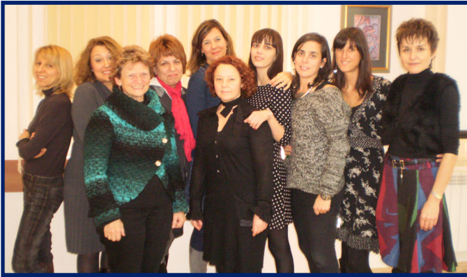
Miembros participantes del proyecto en la reunión inicial