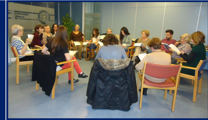
Sesiones de debate intergeneracionales