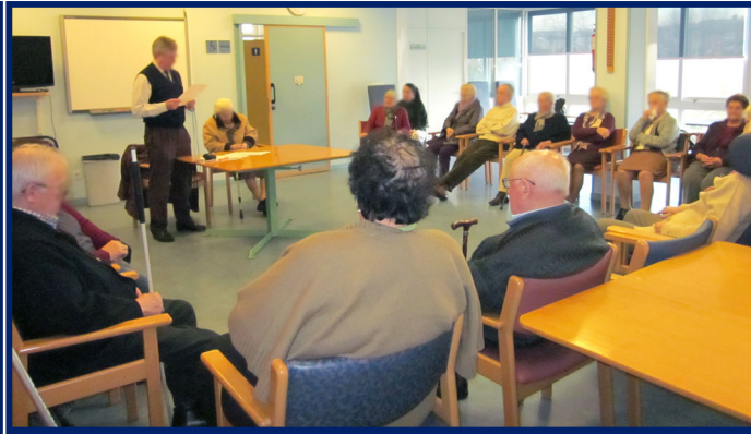
Socios de la UDP-A Coruña participando en un taller de memoria