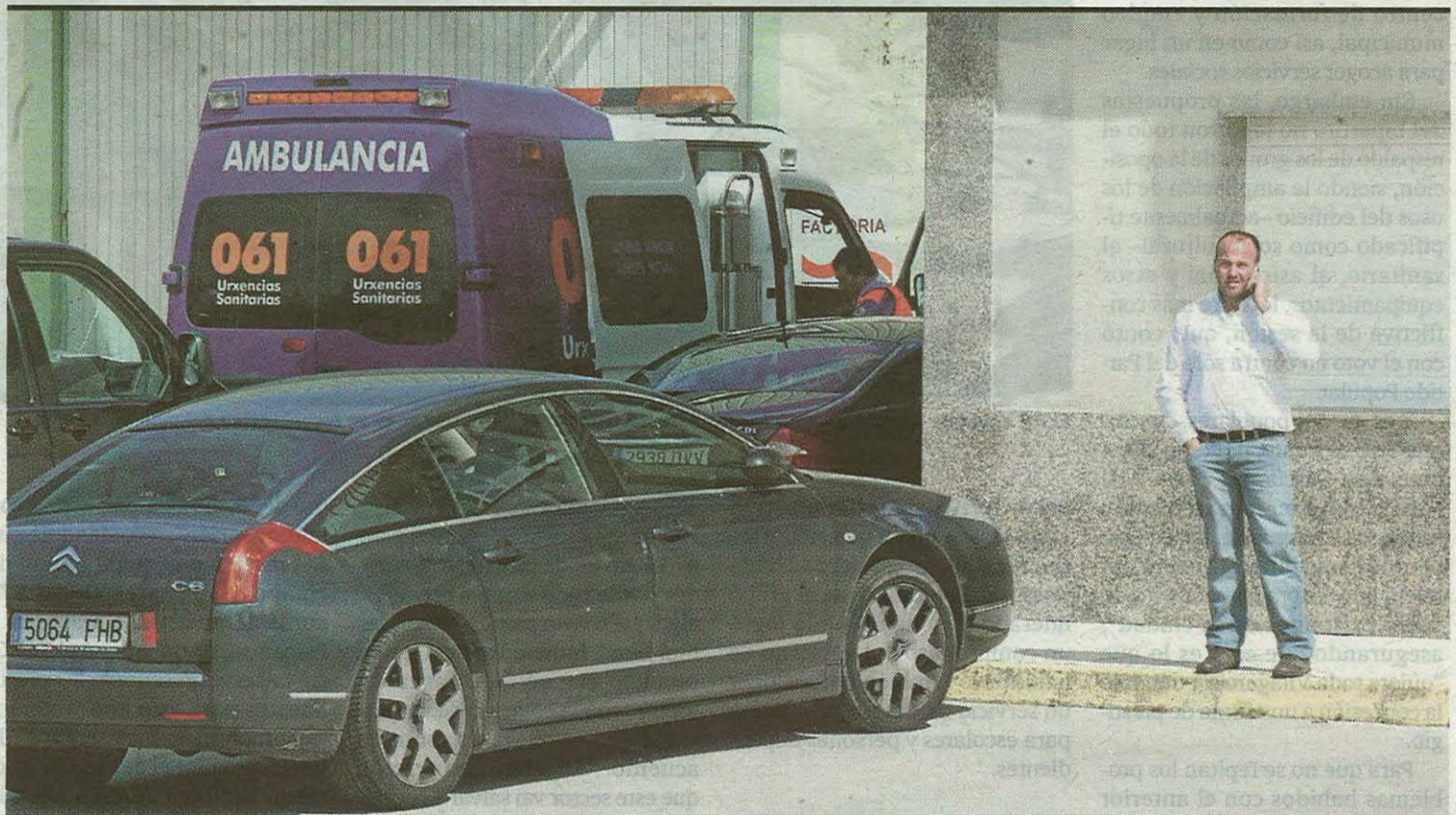
Una ambulancia medicalizada se desplazó hasta el lugar del suceso, pero nada se pudo hacer para mantener con vida al accidentado.

BEATRIZ MATO inaugura en Sanxenxo un congreso de gerontología > 28