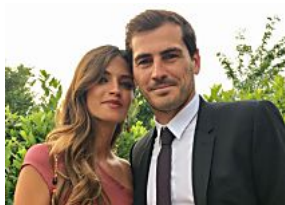
El motivo que ha hecho que Sara Carbonero e Iker Casillas abandonen sus vacaciones y regresen a Madrid