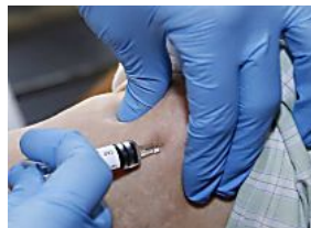
Una "epidemia" de hepatitis A obliga al Sergas a vacunar ya a adultos de riesgo