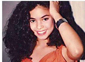
10 Fotos que Shakira desearía olvidar