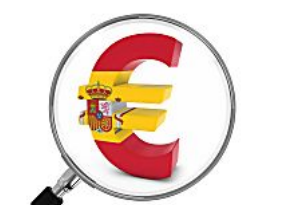
Cómo Invertir Sabiamente Pequeñas Cantidades