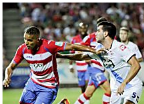
Insua, muy cerca del Schalke